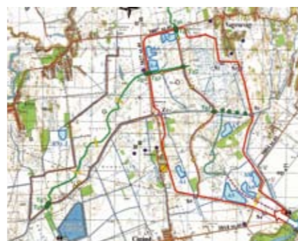
A Cigánd-Tiszakarádi tározó tájgazdálkodási területe

A tájhasználat megváltozását elősegítő mezőgazdasági támogatási rendszer elindításához elengedhetetlenül szükséges a tározók megépítése, valamint a tájgazdálkodási létesítmények, egykori erek helyreállítása is. Ezzel ugyanis kialakulnak az új tájhasználat környezeti feltételei.