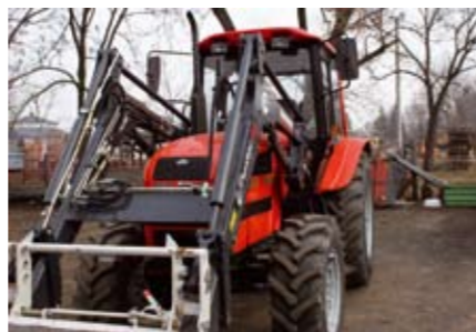
MTZ 920 homlokrakodóval