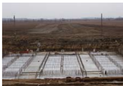
Készül a beeresztő műtárgy alapozása, a háttérben a tározóba vezető vezérárok

Az Európai Unió által társfinanszírozott projekt.