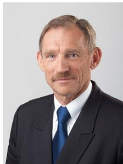
Dr. Pintér Sándor Magyarország belügyminisztere