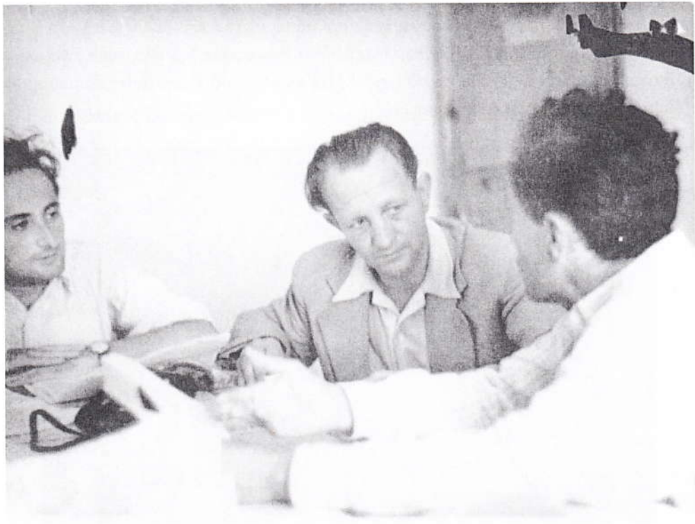
Albániai vízrendezési tervek egyeztetése