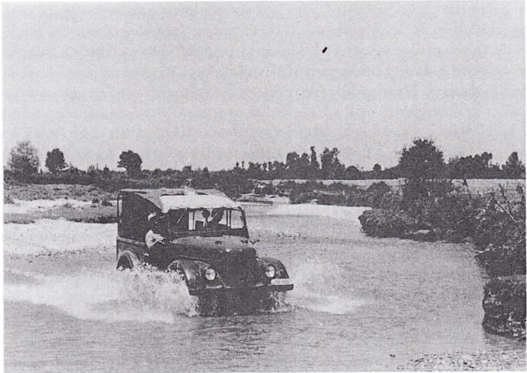
Az albán mocsárvilág